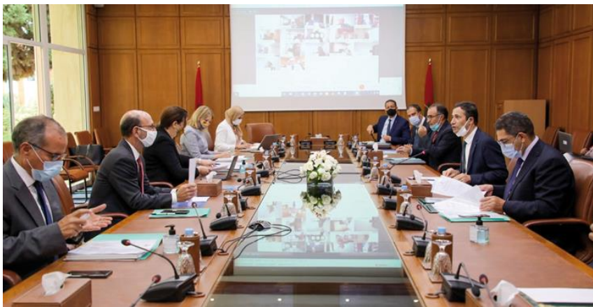
Tenue de la 9 ème session du Conseil d'orientation stratégique (COS) de l'Agence MCA-Morocco

https://aujourdhui.ma/politique/compact-ii-le-maroc-dresse-un-bilan-detape