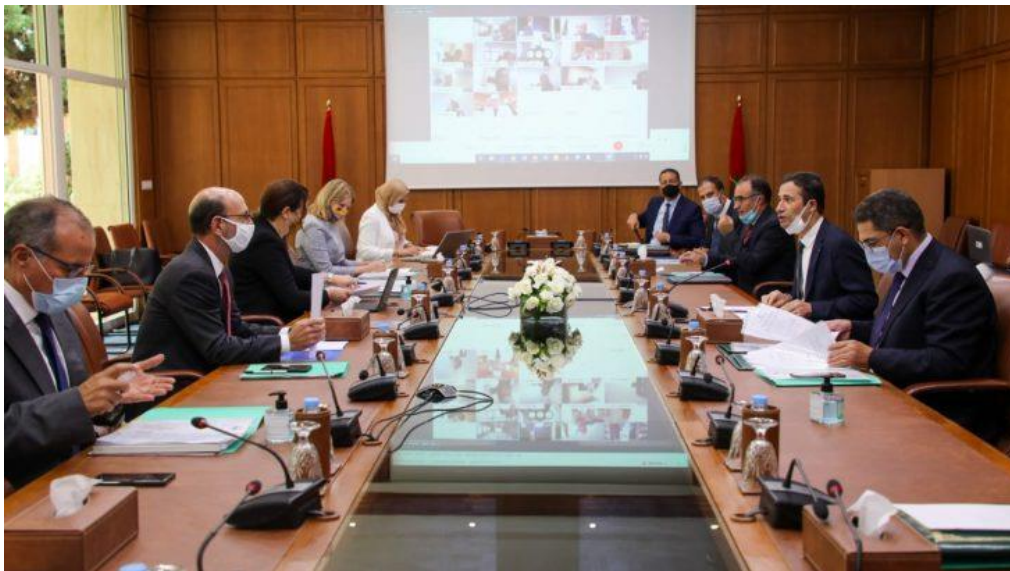
Le Conseil d'orientation stratégique de l'Agence MCA-Morocco tient sa 9ème session:

https://linformation.ma/finance-economie/le-conseil-dorientation-strategique-de-lagence-mca-morocco-tient-sa-9eme-session/45597