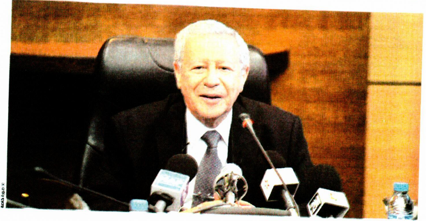
سبق أن جرى تنزيل البرنامج بشكل تجريبي في ستة مؤسسات تعليمية.