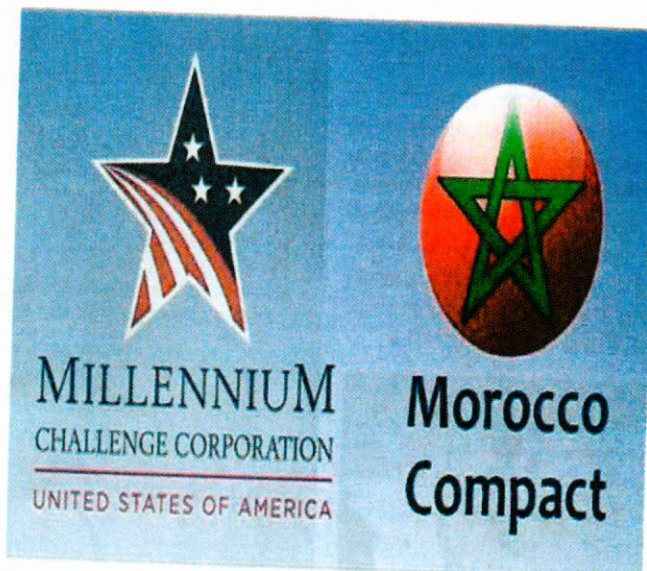
Les établissements sélectionnés profiteront, dans le cadre d'une approche contractuelle, d'un appui intégré.

Doté d'une enveloppe budgétaire de 220 millions de dollars, le projet «Éducation et formation pour l'employabilité» s'articule autour de deux axes.